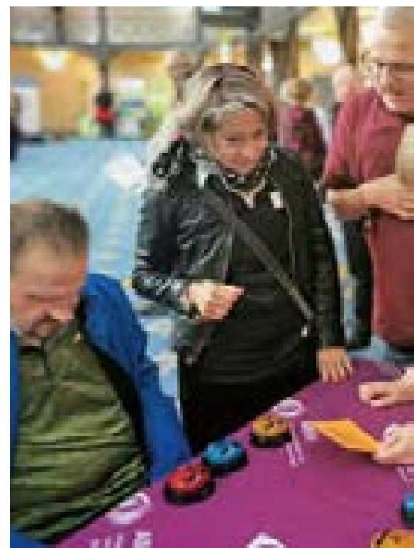
Informationsstand des ABSV auf dem Louis-Braille-Festival in Stuttgart, 2024