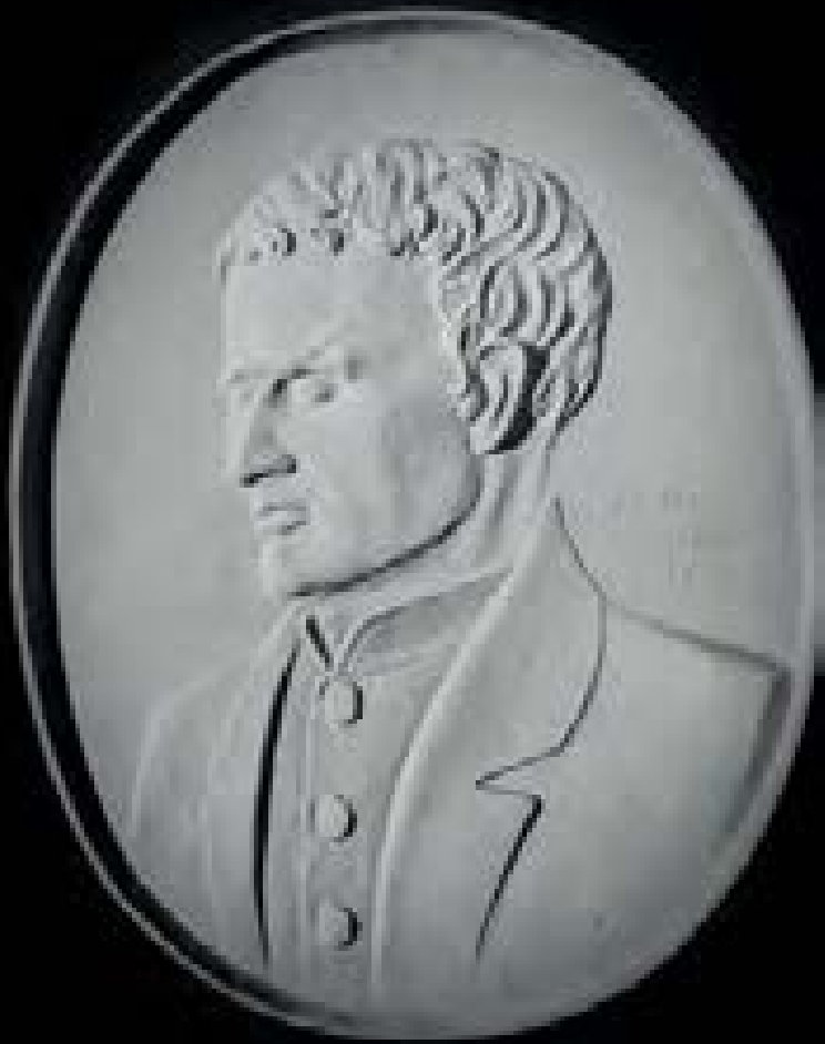
Medaillon mit dem Portrait von Louis Braille, Erfinder der Punktschrift

mung drückt sich auch darin aus, dass mit der Gruppe „der Blinden“ auch Seheingeschränkte ohne Unterscheidung mitgemeint sind. Erst viel später in der Geschichte wird sich dies ändern. Immerhin aber wird 1879, und damit wenige Jahre nach Vereinsgründung, die bereits seit rund 50 Jahren existierende sogenannte Brailleschrift offiziell eingeführt. Diese bis heute gebräuchliche Punktschrift ist benannt nach ihrem Erfinder Louis Braille, und bereits hier im letzten Viertel des 19. Jahrhunderts könnte die Revolution kaum größer sein. Treibende Kraft sind hier die Lehranstalten, denn tatsächlich und zudem gibt es bereits ein eigenes Schulwesen für blinde Schülerinnen und Schüler. Dazu kommen ausgewählte berufliche Tätigkeitsbereiche. Die Berührungspunkte zwi-