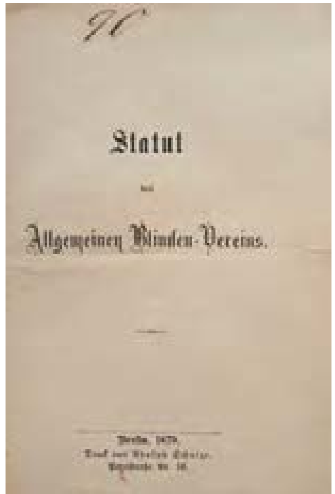
Statut des Allgemeinen Blinden-Vereins, 1879

Eine gemeinsame Reise, vor allen Dingen. Kommen Sie mit? ■