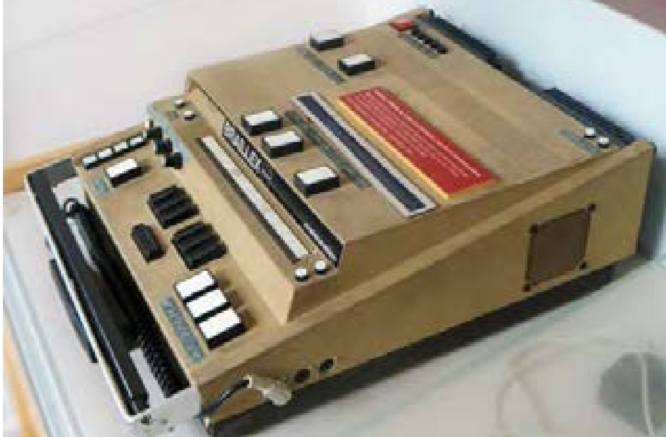
Die Braillex, eine der ersten elektronischen Braillezeilen, ausgestellt im Deutschen Blinden-Museum

und sehbehinderte Menschen zunächst einmal ein Quantensprung in der Kommunikation. Und das nicht nur untereinander, sondern auch im Kontakt mit Sehenden. Auch in anderen Bereichen macht die Barrierefreiheit durch zunehmende Digitalisierungsprozesse große Bewegungen nach vorn. Bei Orientierungssystemen, am Arbeitsplatz, auf dem Bildungssektor und in der Mobilität entstehen wichtige neue Spielräume und dadurch mehr Teilhabemöglichkeiten für blinde und sehbehinderte Menschen.