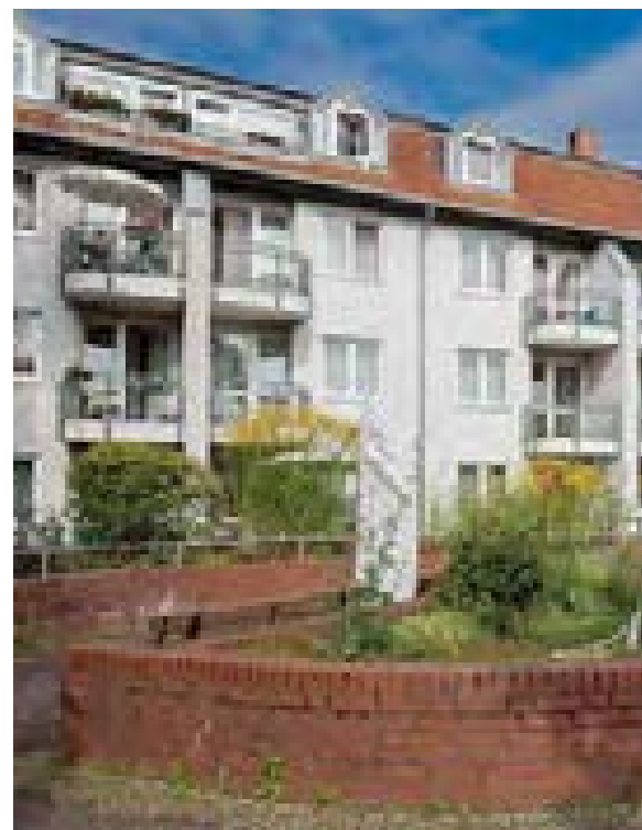
Blindenwohnstätten Berlin, Haus Spandau