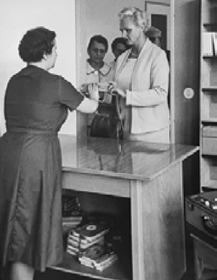
Hilfsmittel zum Hören: Von der Vergangenheit mit Tonband und Abspielgerät...