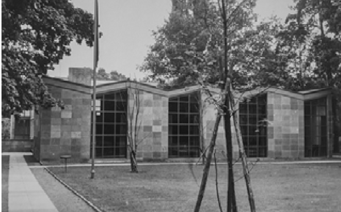
Das neue Vereinshaus des ABV, 1960er Jahre