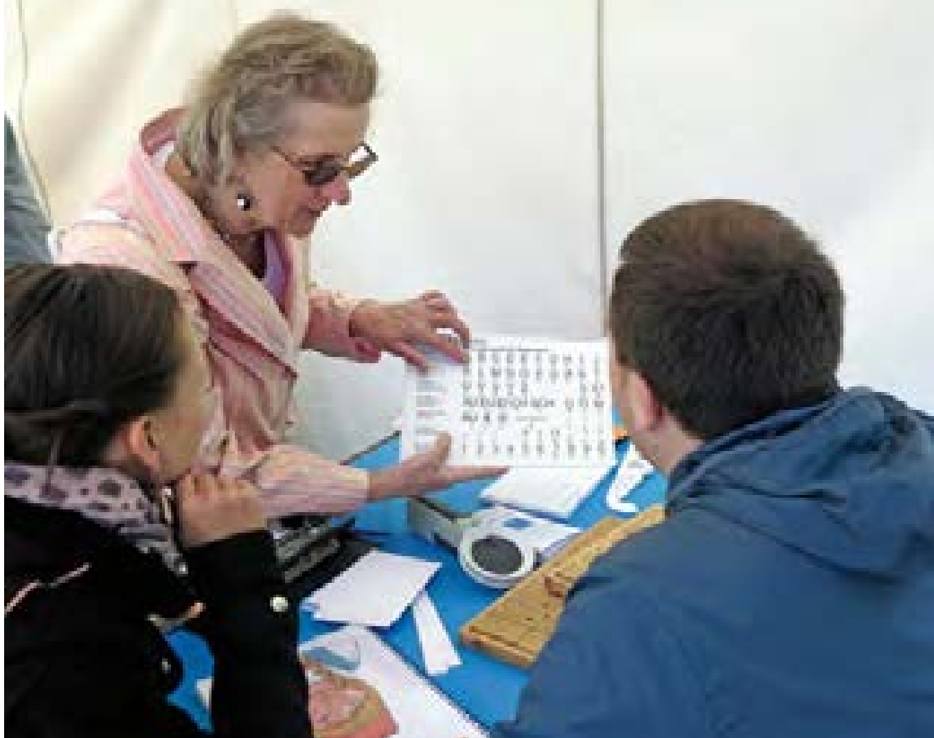
Der ABSV auf dem Selbsthilfe-Tag in Berlin, 2015

wie Rehabilitation, Hilfsmittel, persönliche Assistenz oder Freizeitangebote.