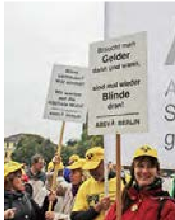
Kampf um das Blindengeld: Auf einer Demonstration 2013

Berlin verabschiedet als erstes Bundesland ein Landesgleichberechtigungsgesetz (LGBG). 2021 erfährt es eine Neufassung und soll die Umsetzung der Grundsätze der UN-BRK in Berlin gewährleisten.