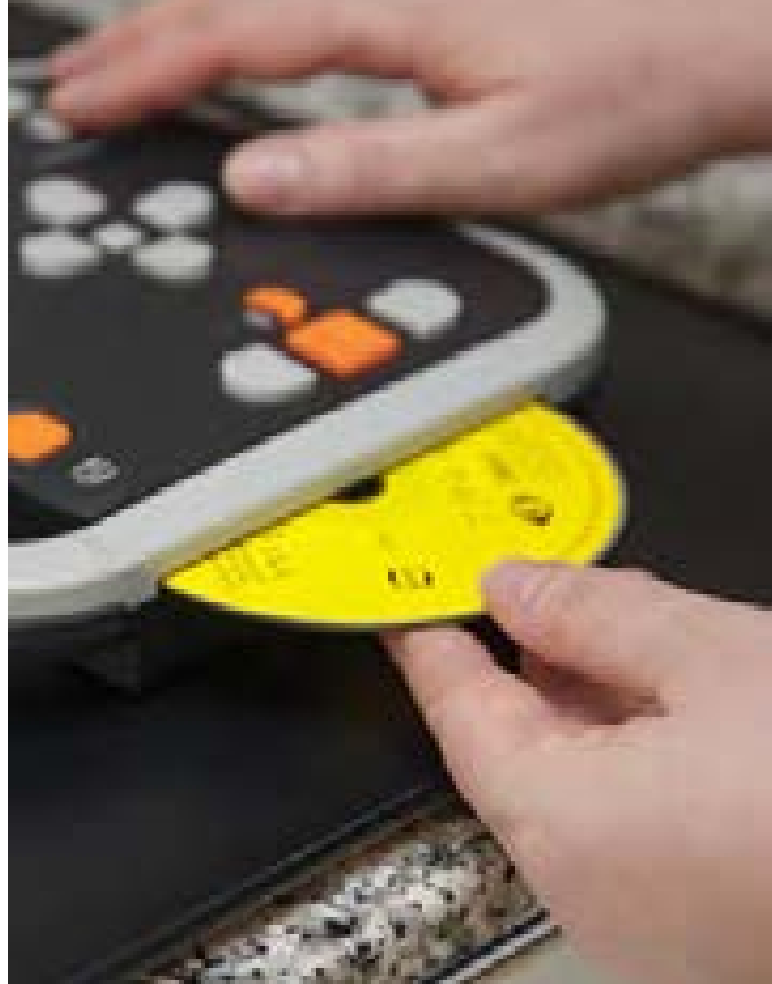
... in die Gegenwart mit DAISY-CD und barrierefrei bedienbarem Abspielgerät