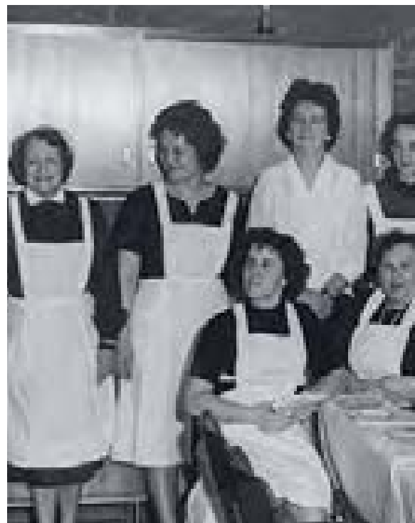
Weihnachtsfeier in einer früheren Senioreneinrichtung des ABV

Der Allgemeine Blindenverein Berlin eröffnet zwei vereinseigene moderne Wohnanlagen für blinde Menschen, 1956 mit 30 Apartments in der Goßlerstraße und 1959 im Rahmen des 85-jährigen Vereins-Jubiläums mit 70 Wohnungen in der Prinzregentenstraße.