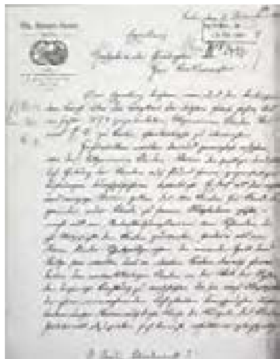
Tätigkeitsbericht des Allgemeinen Blinden-Vereins Berlin von 1909 an das Königlich Preußische Ministerium des Innern, 1909