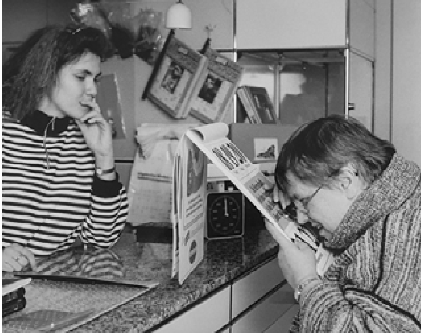
In der Hilfsmittelberatungs- und -verkaufsstelle des ABSV, Ende der 1990er Jahre