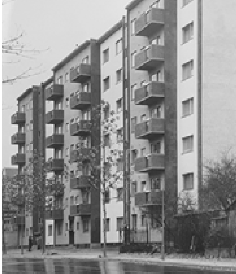
Wohngebäude des ABV in der Prinzregentenstraße

Und das Thema Seniorinnen- und Senioren-Wohnstätten? Dazu ein Sprung zurück in die 1980er Jahre: Überall im Land entstehen neue Wohn- und Pflegeeinrichtungen für ältere Menschen. Welche Lösungen aber bieten sich für blinde und sehbehinderte Seniorinnen und Senioren und für andere pflegebedürftige Menschen, etwa aufgrund einer Mehrfachbehinderung? Aus der Praxis der Beratung wird immer deutlicher, dass normale Wohn- und Pflegeheime auf die Bedürfnisse ihrer nicht-sehenden Klientel, zumal in den verschiedenen Abstufungen, nicht genügend eingehen können. So eröffnet der Allgemeine Blindenverein Berlin 1989 mit den Blindenwohnstätten Spandau nicht nur die erste hierauf spezialisierte Wohn- und Pflegestätte Berlins, sondern der ganzen Bundesrepublik. Heute bietet die Einrichtung 100 in Wohngruppen organisierte Plätze für blinde und sehbehinderte Seniorinnen und Senioren an sowie 20 Plätze für blinde und sehingeschränkte Menschen mit einer Mehrfachbehinderung. Die Idee: barrierefreie Architektur, abge-