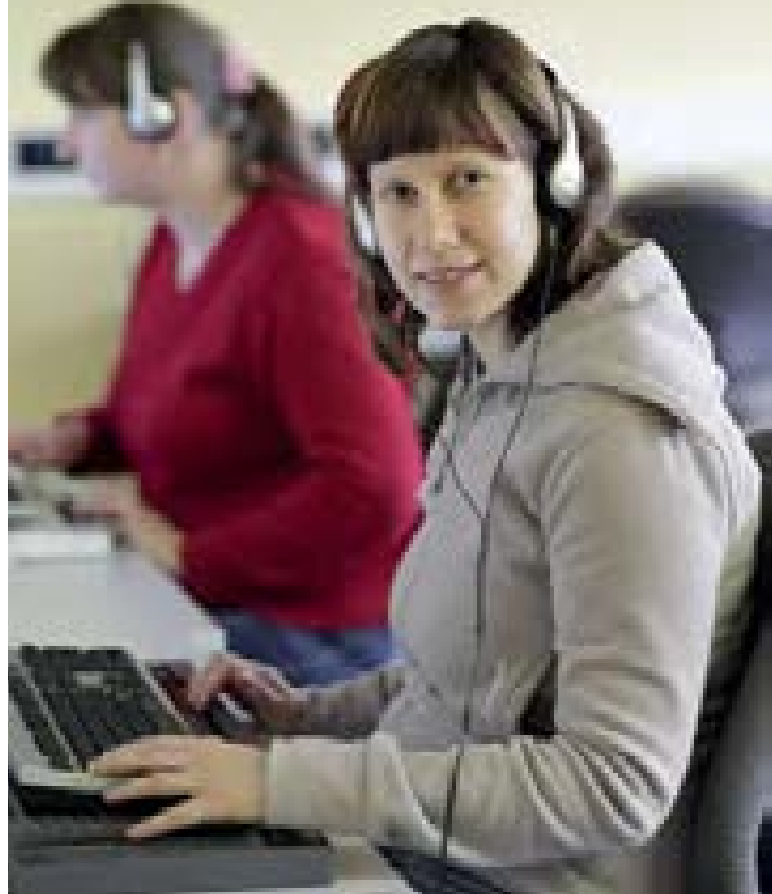
Moderner, blindengerechter Arbeitsplatz

Für Arbeitsmöglichkeiten für blinde Menschen in Berlin sollen zunächst verschiedene Werbemaßnahmen sorgen, die etwa das Handwerk mit dem Handel verbinden. Mit dem späteren Schulterschluss mit der Industrie schließlich gelingt ein weiterer Durchbruch, in der Produktion am Fließband, aber auch bei Büro- und kaufmännischen Berufen, allen voran bei AEG und