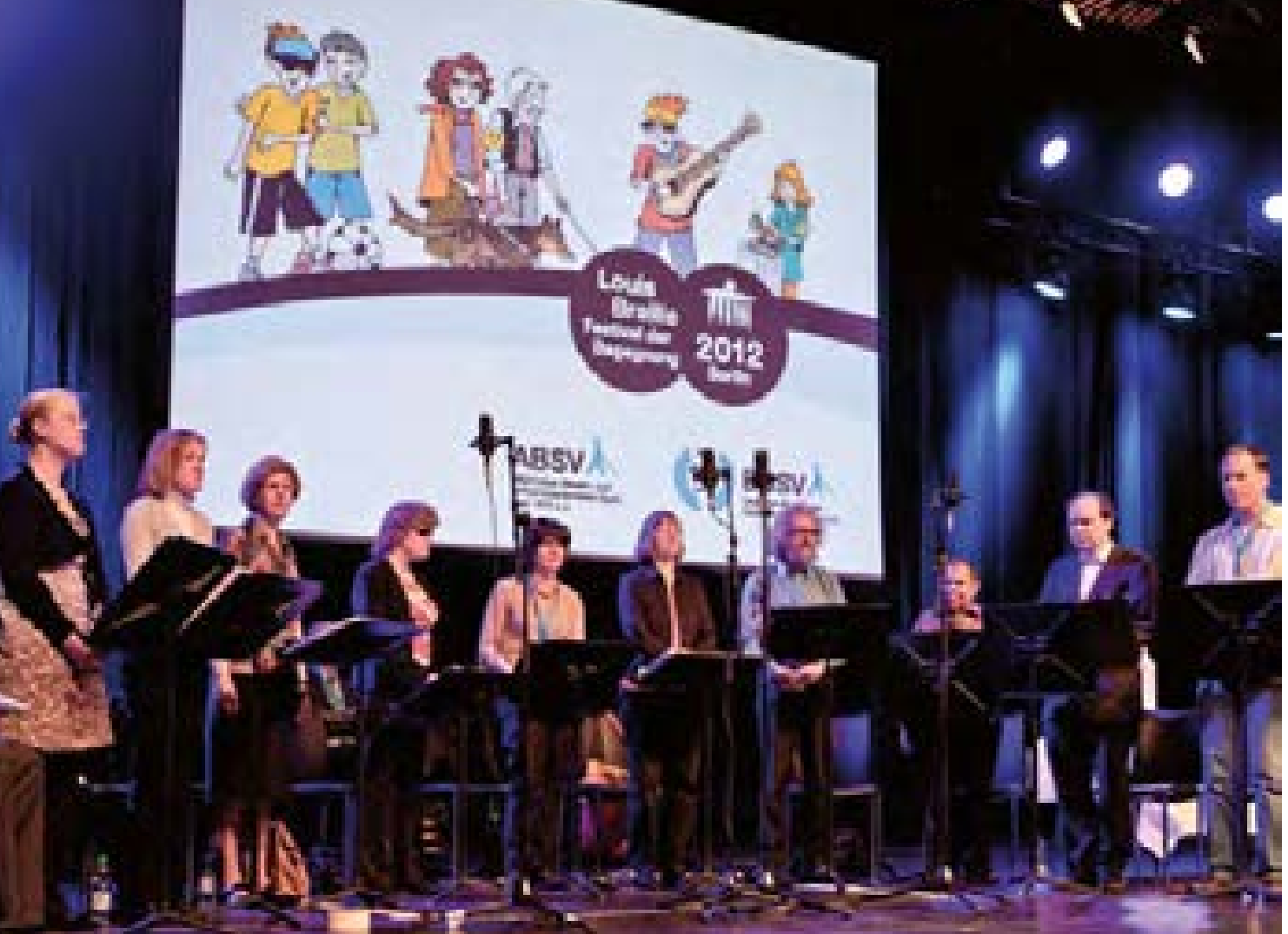
Auf dem Louis-Braille-Festival in Berlin, organisiert von DBSV und ABSV, 2012