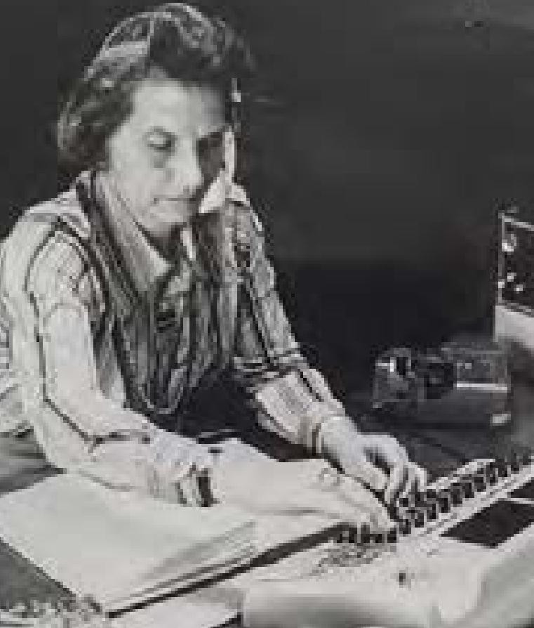
Blinde Stenographin an ihrem Arbeitsplatz

Arbeit fähig sind wie alle anderen auch. Dieser Gedanke wiederum ist durchaus heutig. Und blinde Menschen in den Anstalten begehren auf gegen fremdbestimmtes Leben, Lernen und Arbeiten. Die sie institutionell Begleitenden finden das in weiten Teilen vor allem undankbar. Aber die Entwicklung ist nicht mehr aufzuhalten.