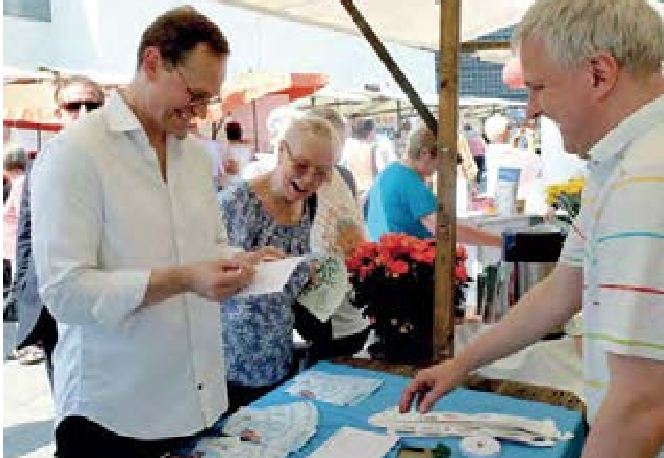
Informationsstand des ABSV auf der Berliner Seniorenwoche, 2016

» Alle Menschen mit (drohendem) Sehverlust, wozu blinde und sehbehinderte Menschen, blinde und sehbehinderte Menschen mit weiteren Behinderungen und Augenpatientinnen und -patienten zählen, sollen in jedem Lebensbereich eine vollständige und gleichberechtigte Teilhabe erfahren. Unsere Vision ist daher eine inklusive Gesellschaft, wozu die Selbsthilfe einen wesentlichen Beitrag leisten soll.