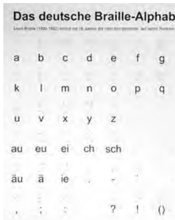
Deutsches Braille-Alphabet, basierend auf Louis Braille