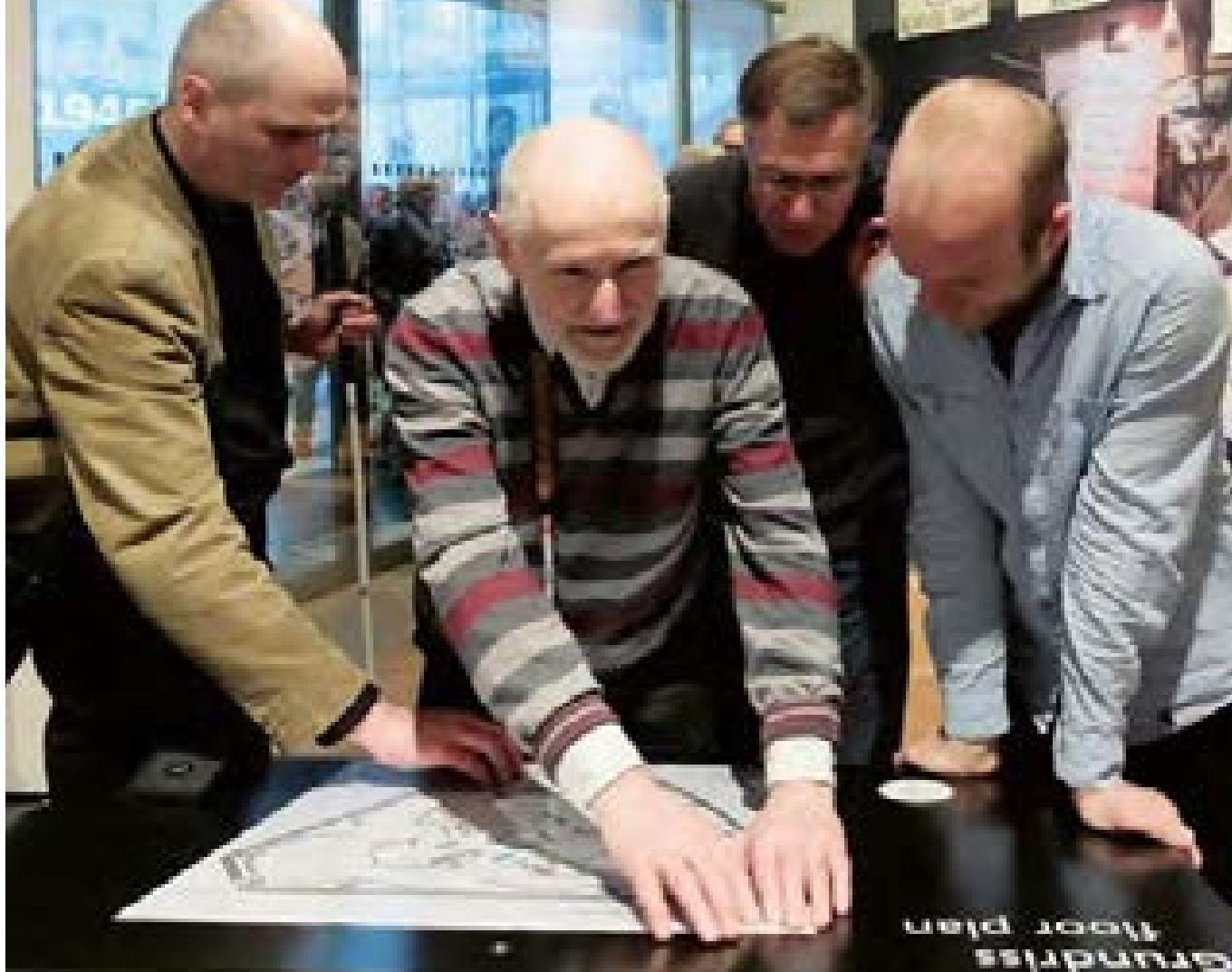
Test einer barrierefreien Ausstellung im Deutschen Historischen Museum, 2015