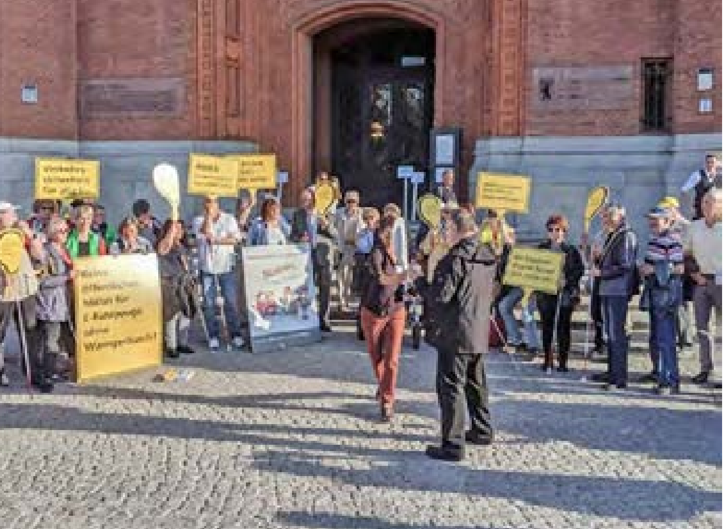
Demonstration für mehr Verkehrssicherheit beim Thema Elektro-Mobilität, 2019