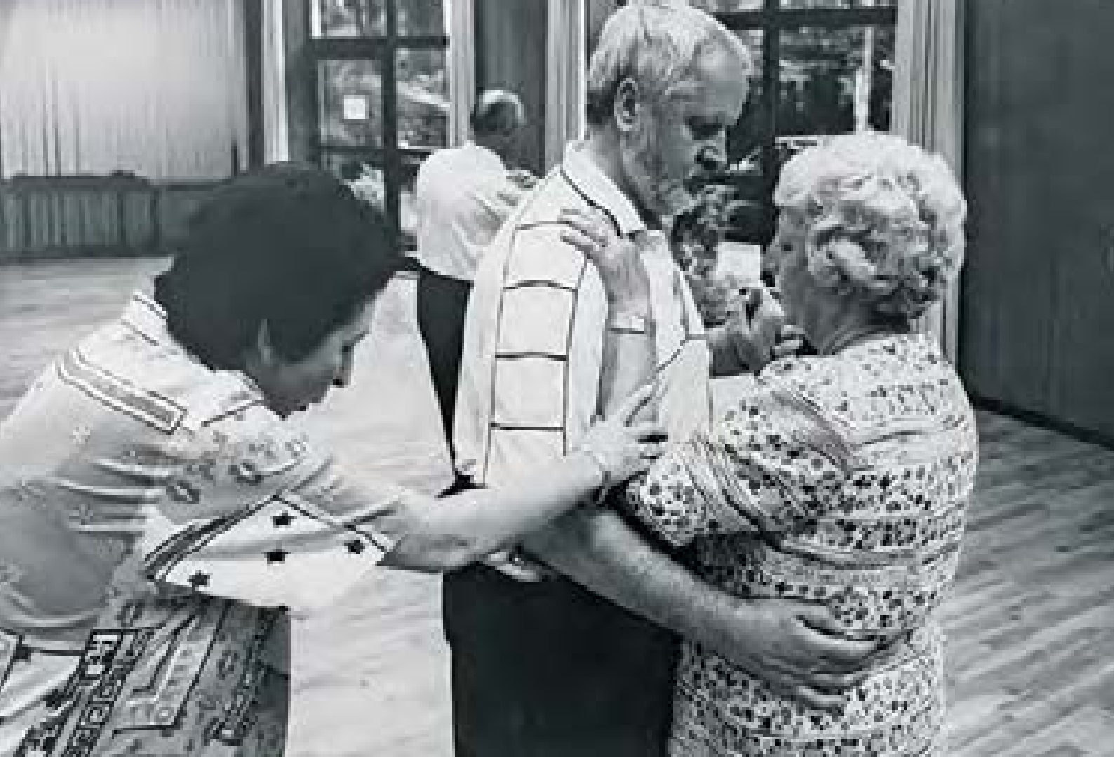
Tanzstunde im ABV mit dem Berliner Blinden-Tanzklub BBTK, vermutlich 1970er Jahre

bote, zugeschnitten auf die Bedürfnisse blinder und sehbehinderter Menschen, ein Thema werden. Denn am Beginn der Vereinsarbeit stehen zunächst gravierende Themenbereiche.